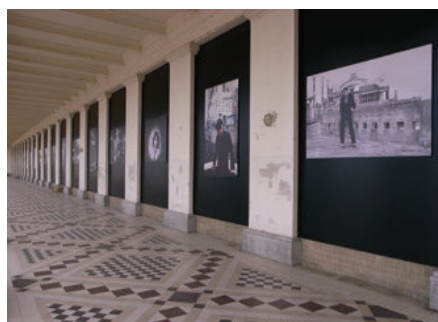
Mutoh Deutschland | www.mutoh.de