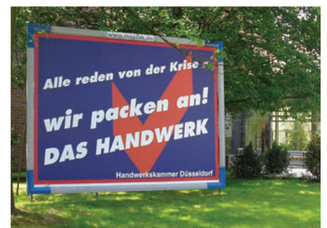
Mutoh North Europe | www.mutohnorth.eu