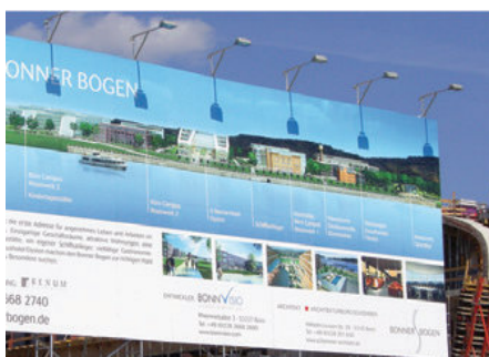
Mutoh Europe | www.mutoh.eu

Geeignet für die Produktion von Wegeleitsystemen, Beschilderungen, FineArt-Drucken, Messedrucke, PointOfSales, Verpackungsprototypen etc. Der PerformanceJet 2508UF wird die Produktionsmöglichkeiten jeden Druckdienstleisters sowie die Produktvielfalt sehr schnell erweitern.